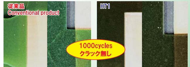
-65°C (30min) ⇔150°C (30min) 1000cycle