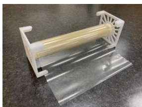
〈低ロス感光性層間絶縁フィルム〉 →

IoT・AI・仮想空間等の社会への浸透に伴い、情報処理量が急増し、それに応えるべく次世代半導体パッケージでは高密度化のニーズが高まっております。高密度化のためには、パッケージを構成する再配線層の性能向上が必須であり、本製品は当該ニーズに対応し、これまでの再配線層の欠点である電気特性、微細化対応、反り、工程複雑性を抜本的に改善する新しいタイプのフィルム材料です。