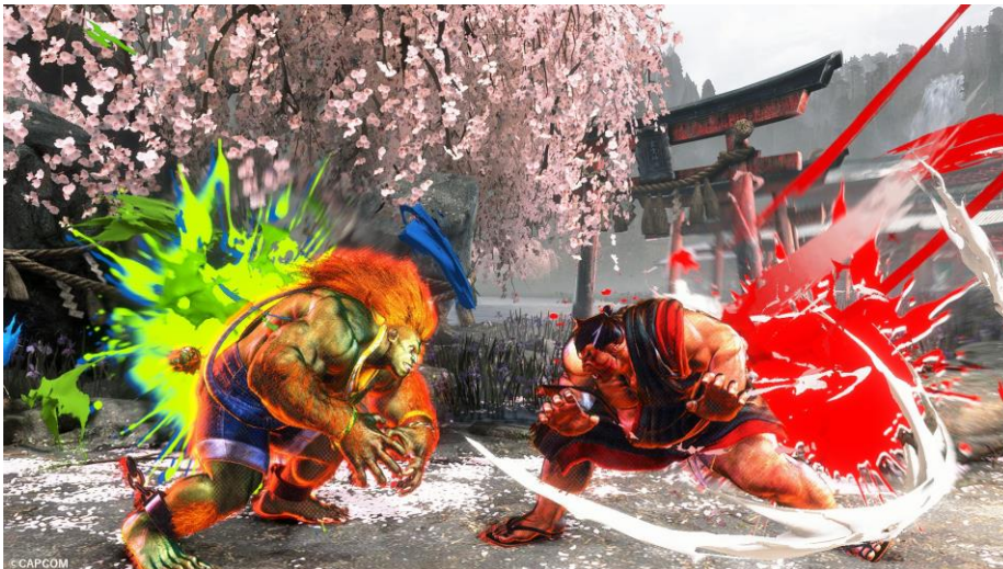
『ストリートファイター6』ドライブシステム BATTLE SYSTEM DESIGN @CAPCOM

本商品は、SNS上でのストリートファイターリーグファンの声をきっかけに、社長室 広報/ブランドマーケティング課内で実施された社内コンペを経て商品化されました。商品のキャッチコピー「楽しい世界は、“楽しむ奴”がつくりだす。」は、ストリートファイターシリーズを代表するキャッチコピー「俺より強いやつに会いに行く」をオマージュし、太陽ホールディングスのブランドステートメント「楽しい世界は、楽しむ人がつくりだす。」をアレンジしています。『ストリートファイター6』の特性であるドライブシステムのBATTLE SYSTEM DESIGNをモデルに、当社エレクトロニクス事業の主力製品である絶縁インキ（ソルダーレジスト）を想起させるデザインを施しました。36個でひとつの絵柄となるようにデザインしています。