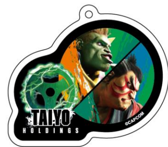
アクリルキーホルダー

アクリルキーホルダーとパッケージには、太陽ホールディングスのコーポレートカラーの緑とエレクトロニクス事業と親和性のあるブランカと、「ストリートファイターリーグ：ワールドチャンピオンシップ 2024」の会場である両国国技館にちなみ、エドモンド本田を起用しました。バレンタインデーでのプレゼントや自分へのご褒美、お世話になった方への贈り物として、ぜひお買い求めください。